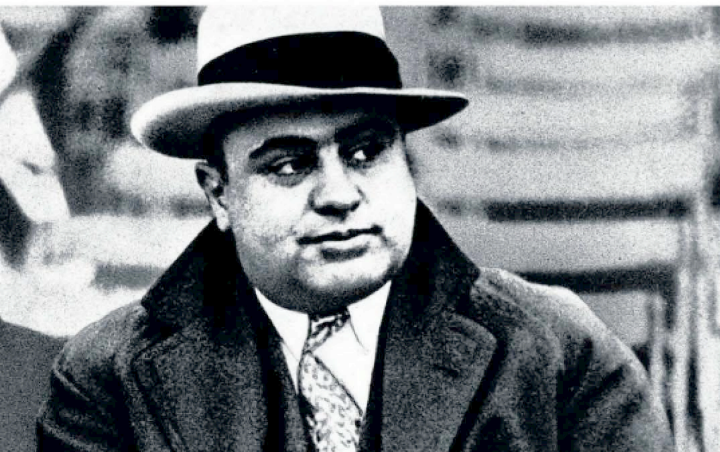
Drugsbaas Al Capone, die in The Untouchables werd vertolkt door Robert De Niro, in 1931.