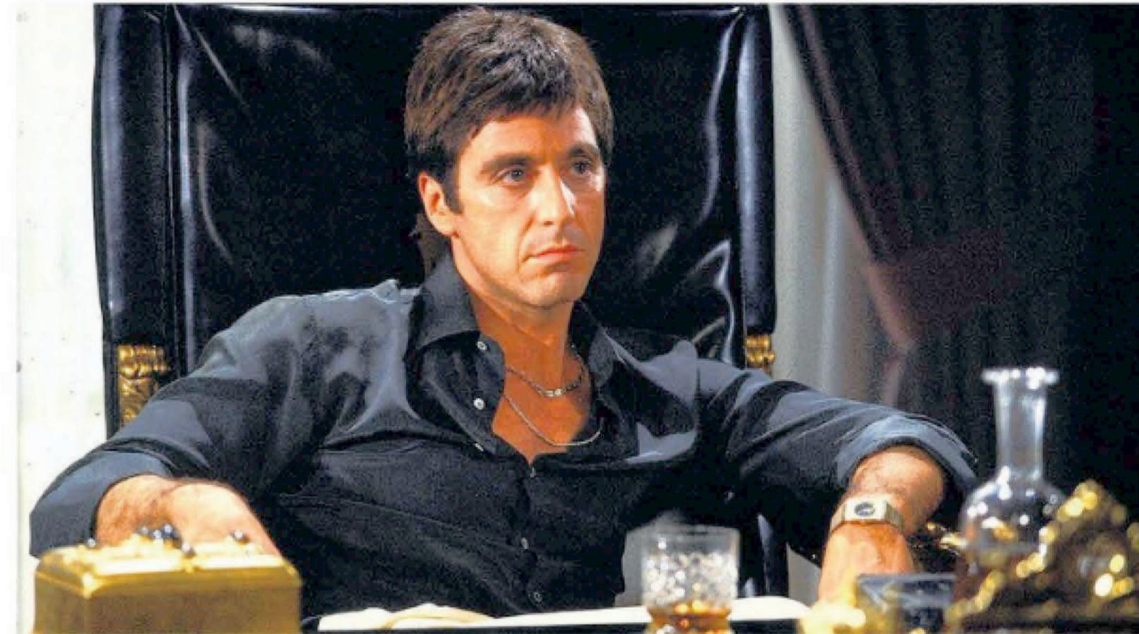
Al Pacino als Tony Montana in Scarface .