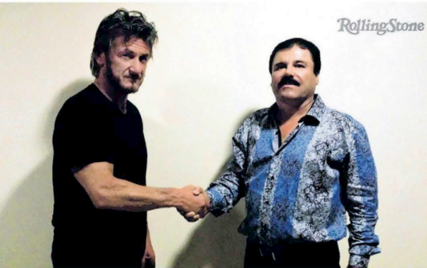
Drugsbaas Joaquin 'El Chapo' Guzmán (r) schudt de hand van acteur Sean Penn.