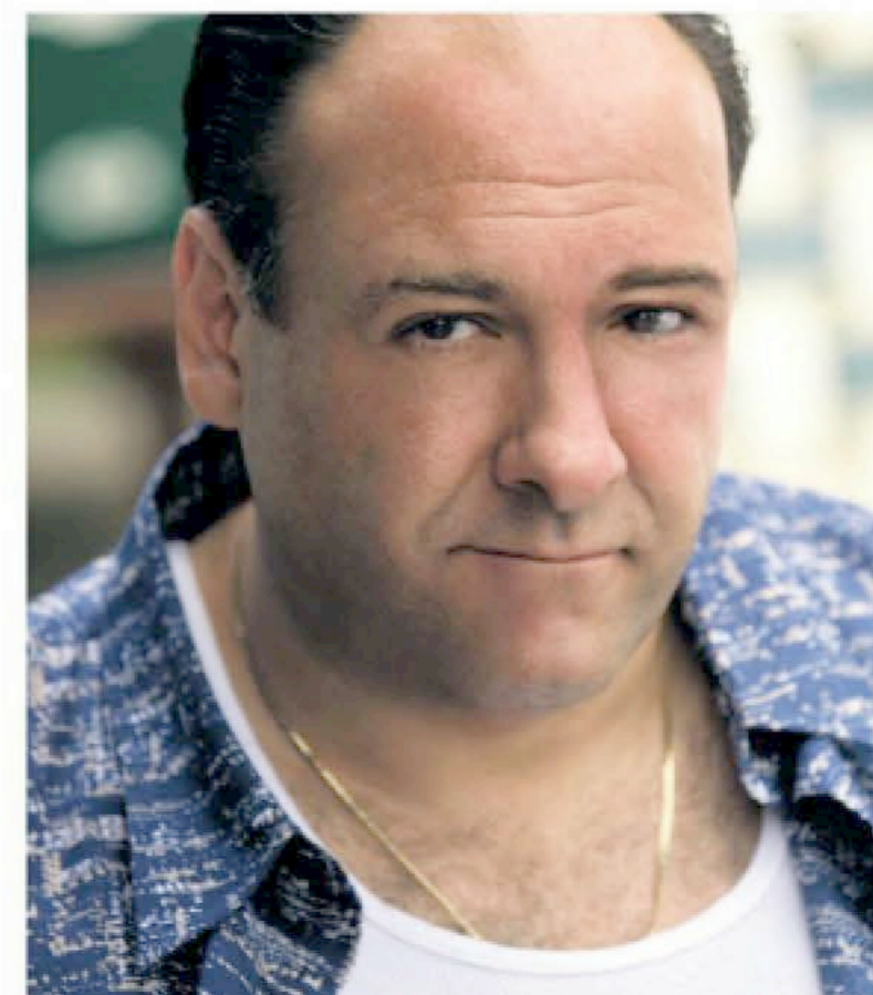
James Gandolfini als Tony Soprano.